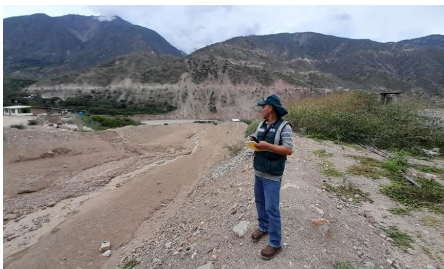
IMAGEN N°01: Se observa la quebrada Calquiche que requiere de conformacion de bordos y proteger ambas margenes en este sector