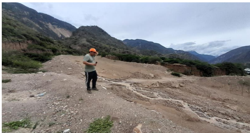
IMAGEN N°02: Se observa la colmatacion en la quebrada Calquiche que requiere de mantenimiento del cauce